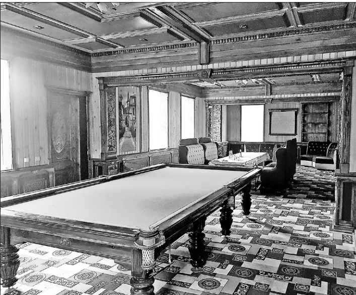
Так выглядит изнутри гостевой дом с бильярдом и бассейном

поддержали, причем не только на словах. Сейчас готовится проект газопровода до села Ошкуново и деревни Журавлевой, подведут газ и к строящемуся комплексу. Запланирована реконструкция дороги, недалеко от которой находится комплекс.