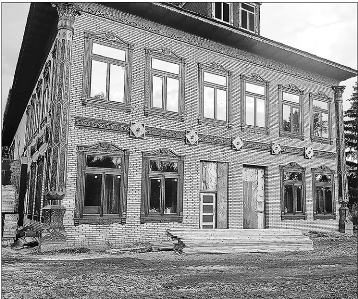
Здания лагерной инфраструктуры реконструировали и отстроили заново

– Была задумка построить оздоровительный комплекс для спортивных команд и обычных жителей