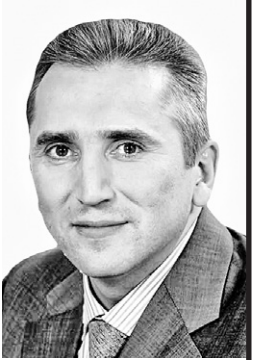
Александр МООР, губернатор Тюменской области

на открытии VII бизнес-форума «День знаний для предпринимателей» 11 сентября