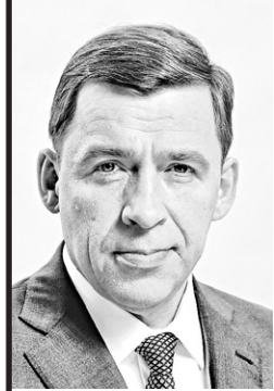
Евгений КУЙВАШЕВ, губернатор Свердловской области

на встрече с представителями малого и среднего бизнеса 17 мая