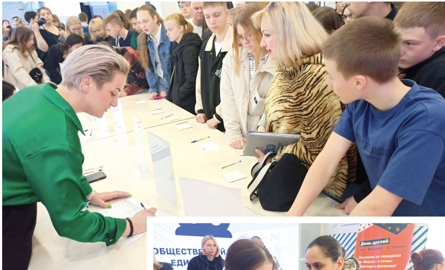
Ярмарка пользуется спросом среди подростков

– Наша компания предлагает гарантированное трудоустройство, карьерный рост – в течение полугодия легко можно подняться до менеджера предприятия. Есть несколько видов премии, оплачиваемая медицинская книжка. В данный момент открыты вакансии кассира и кухонного сотрудника, – заявляет представитель сети предприятий быстрого питания.