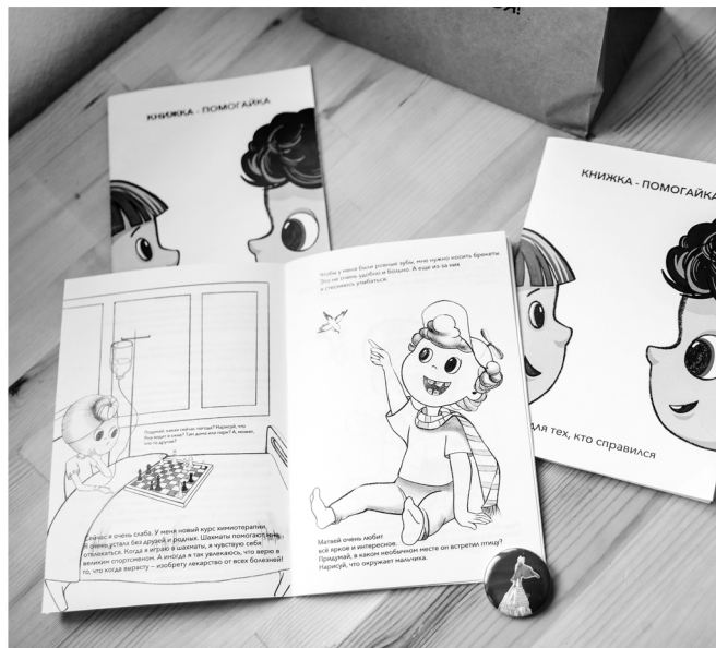
Книжки-раскраски помогают детям отвлекаться

она молодец, справилась с бедой! Как только доктор это сделал – девочка заплакала. Она плакала несколько часов.