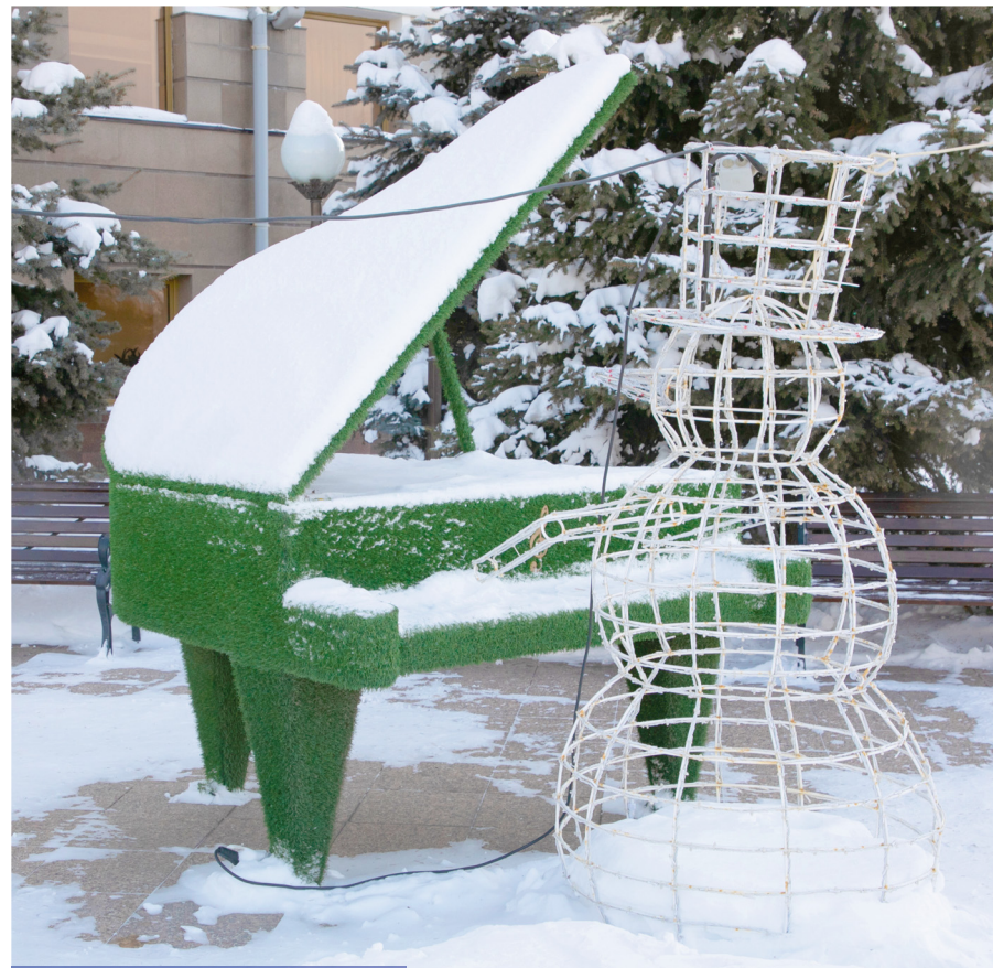
Рояль у Тюменской филармонии