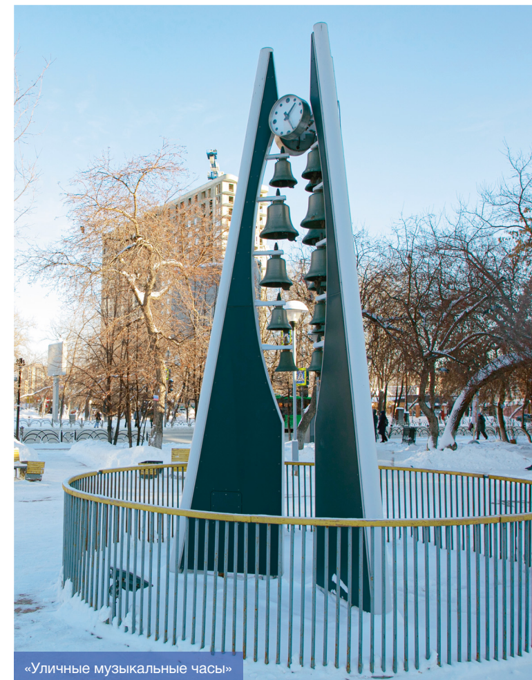
«Уличные музыкальные часы»