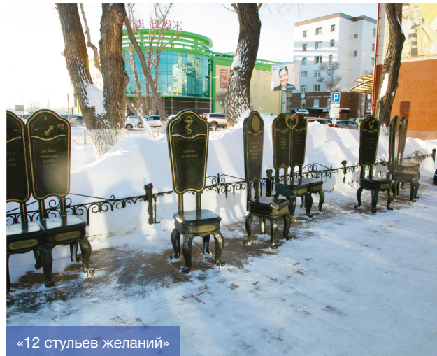
«12 стульев желаний»