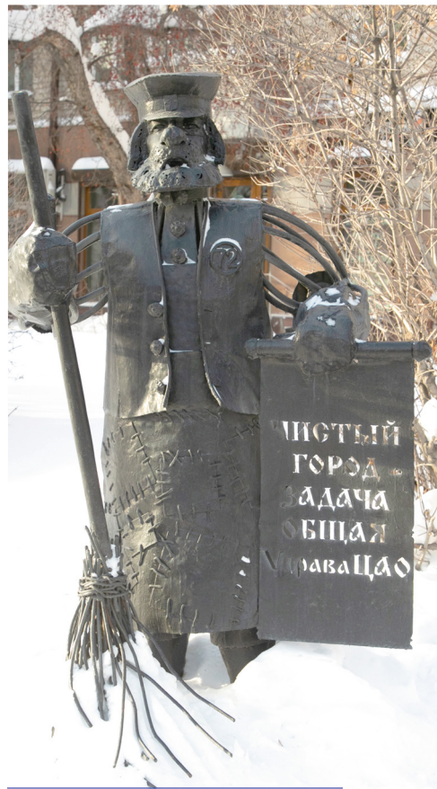
Скульптура тюменского дворника