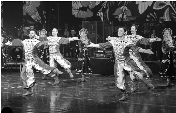
В зале собрались более тысячи зрителей. Это врачи, учителя, правоохранители, а также жены и матери участников СВО