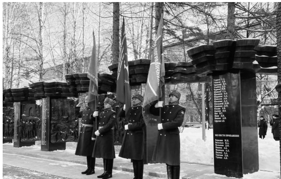
Место символическое – на доске памяти на площади имени Губкина высечены сотни имен погибших военных

– Российский солдат всегда оказывал помощь и поддержку дружественным государствам. Сегодня мы помним и чтим память