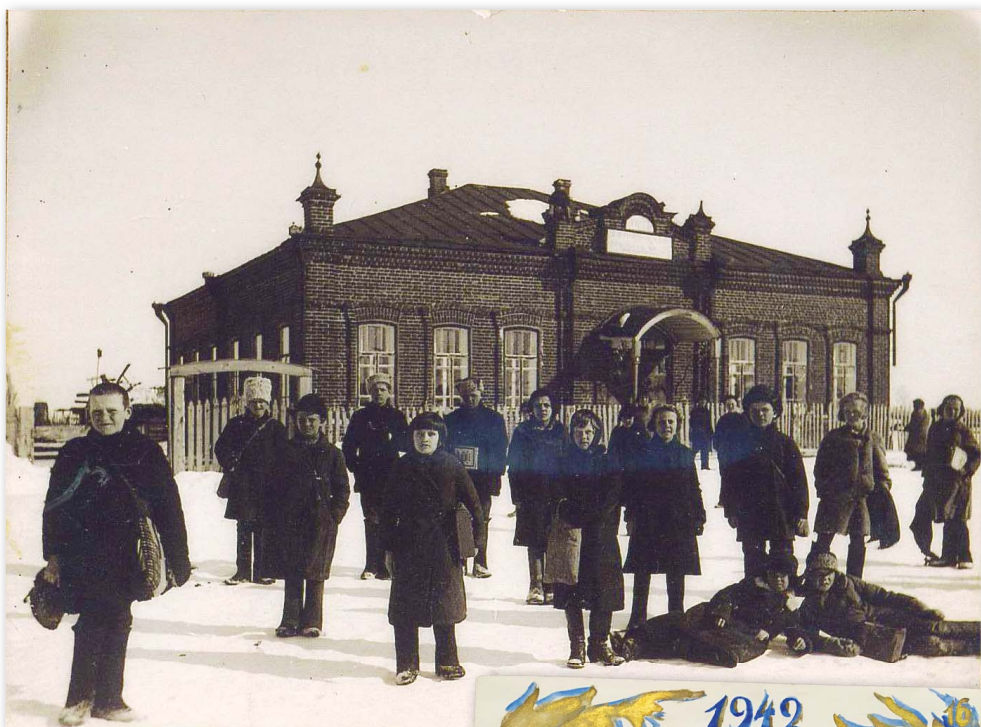
Здание, где в годы войны располагался интернат