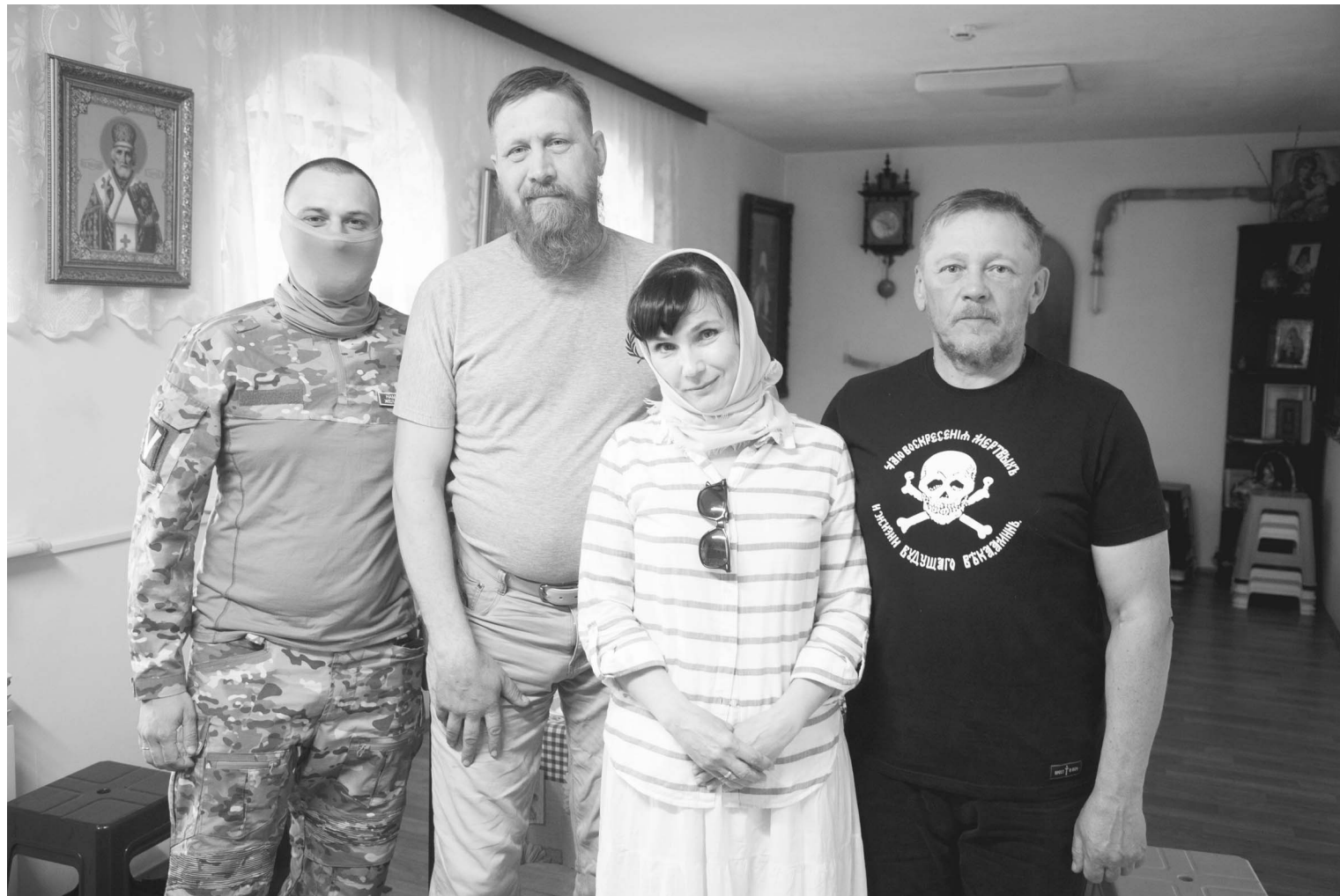
Только когда все в тылу встанем единым фронтом, тогда и победа будет, считают волонтеры || Фото Сергея КУЛИКОВА

Эвакуационная тележка тоже нашла применение. С ее помощью и под прикрытием РЭБ с переднего края доставили тела погибших. Это большое дело. Груз 200 на войне особенный. Его обязательно нужно забрать с поля боя и проститься с товарищем, воздав ему все воинские почести.