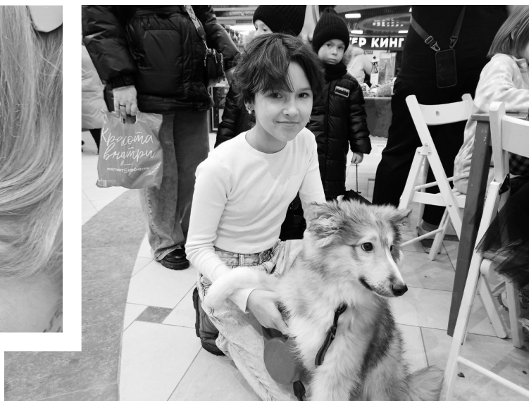
В первую очередь в фонд попадают котята, щенки и травмированные животные – те, кому без помощи человека на улице не выжить

Затем животное попадает на дружную передержку, где ждет, когда его заберут домой. К сожалению, иногда