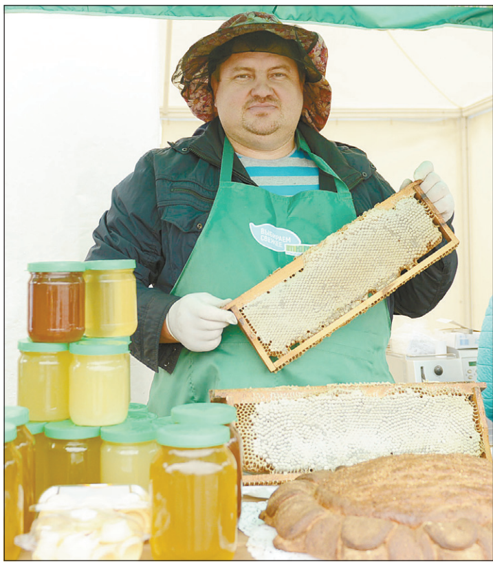
Полезный мед с сибирских пчел

С утра в воскресенье на улицах областного центра было многолюдно и празднично. И не мудрено – гастрономический фестиваль «Мед и хлеб» пошел на ура.