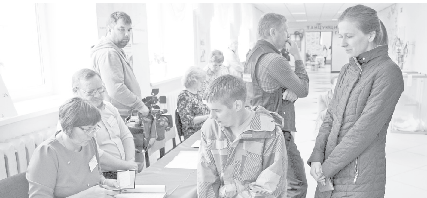
Тюменцы голосуют за стабильность и поступательное развитие региона

9 сентября в единый день голосования ранним воскресным утром в Тюмени распахнули двери 1 095 избирательных участков.