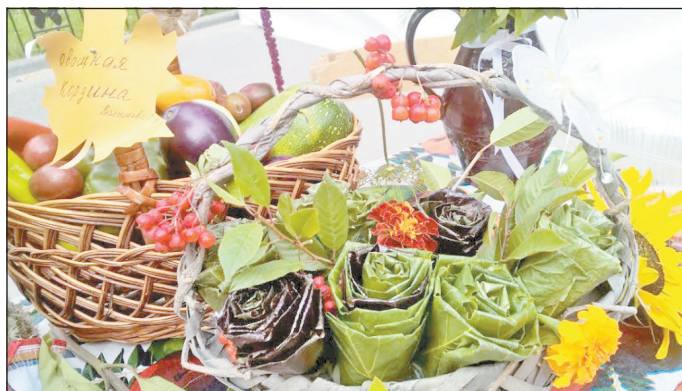
Фрукты и овощи с дачного подворья передали одиноким тюменцам