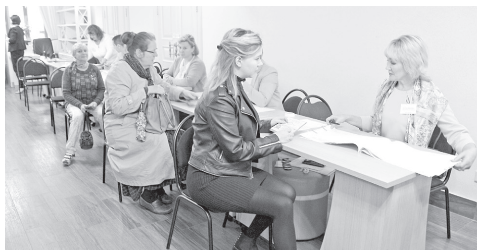
9 сентября жители областного центра избрали депутатов представительного органа местного самоуправления

– В горизбирком в течение дня голосования поступило семь жалоб. Все они от уполномоченного представителя политической партии КПРФ. Еще две жалобы поступили ночью от представителя самовыдвиженца по третьему