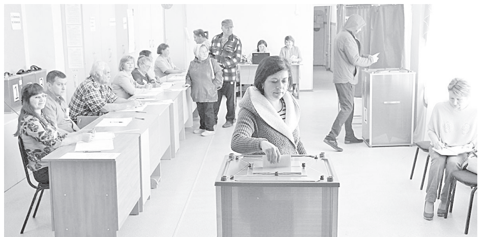
Голышмановцы традиционно отличаются высокой гражданской активностью