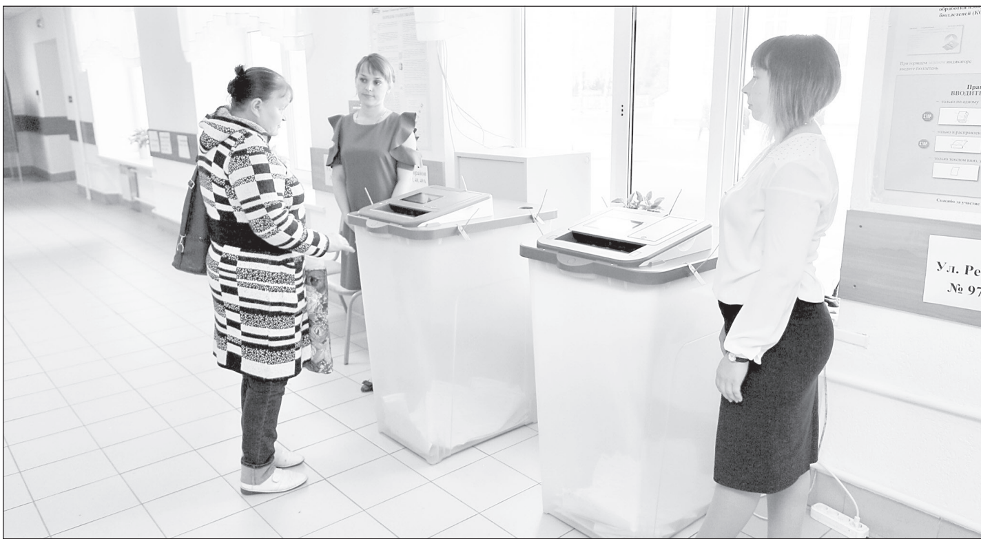
Явка на выборах в Тобольске составила 61,74 процента

В Тобольске в единый день голосования работало полсотни избирательных участков. Жители 13-го избирательного округа кроме главы Тюменского региона выбрали депутата в Тобольскую городскую Думу.