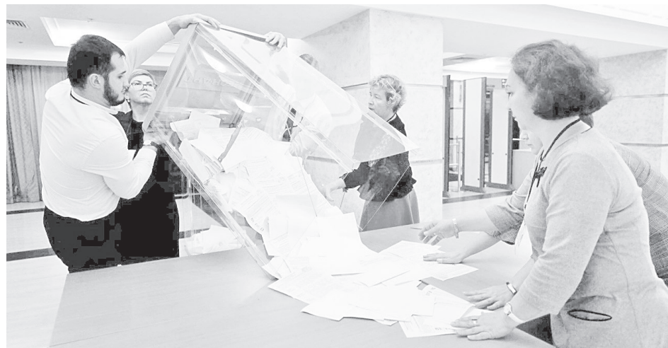
Подсчет голосов на всех избирательных участках проводился строго в соответствии с законом, в присутствии наблюдателей

Нарушений на участке в Молодежном не зафиксировали. Впервые голосовали два молодых человека, которых недавно исполнилось 18 лет. Два раза комиссия выезжала на дом к людям с ограниченными возможностями здоровья.