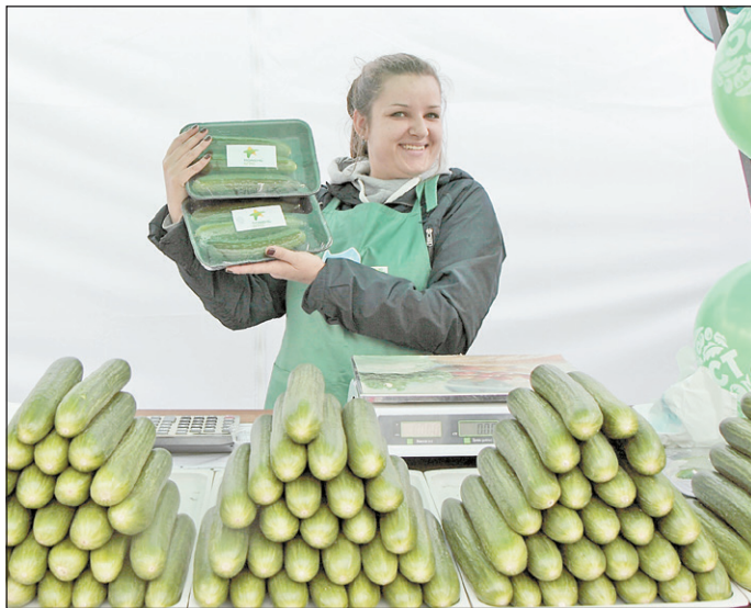
Наримановские огурцы любимы тюменцами

Местные производители предлагали горожанам колбасную, рыбную, молочную и кондитерскую продукцию со