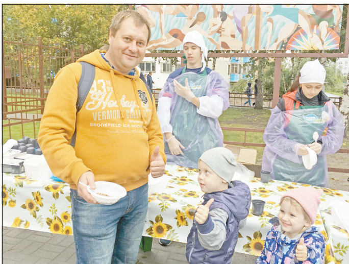
В дождливую погоду горожане могли подкрепиться горячей кашей

В этот день жители областной столицы пели и танцевали, всей семьей пробовали свои силы на фестивале ГТО, проверяли здоровье, лакомились вкусными блюдами и выпечкой и выиграли почти 500 крупных подарков. В течение дня нашли своих счастливых обладателей 4 квартиры, 8 машин «Лада Гранта», 17 мобильных телефонов, 16 телевизоров и 19 микроволновых печей.