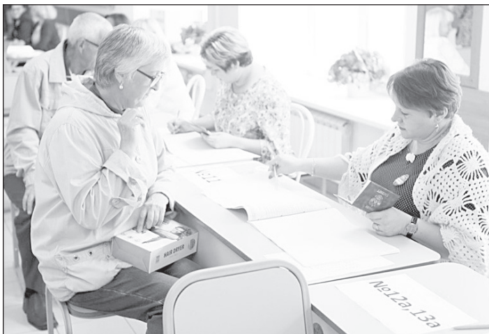
Для тоболяков выборы – праздник и большая ответственность