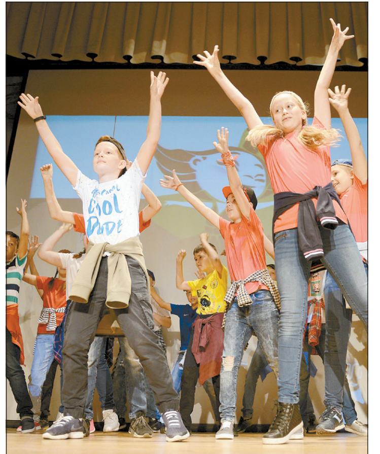
Победители марафона получили туристические путевки по региону

9 сентября с утра во всех школах областной столицы стартовал марафон «Танцующий город» – готовились к нему ребята и их родители с первых дней нового учебного года.