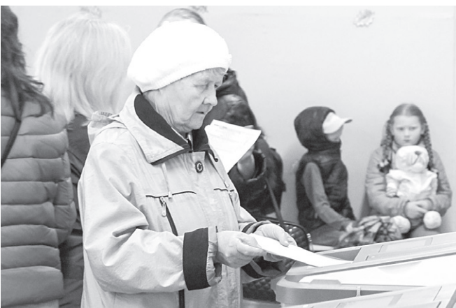
На избирательных участках в Тюмени были установлены как привычные прозрачные урны для голосования, так и электронные – КОИБы