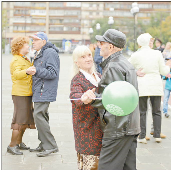
Представители старшего поколения вальсировали под любимые мелодии

Фестиваль «Тюменская осень» у драматического театра начался с выступления местного духового оркестра МЧС ровно в 10.00, как и планировалось. Напомним, что впервые перед горожанами коллектив сыграл во время концерта 9 Мая 2018 года. И вот спустя целое