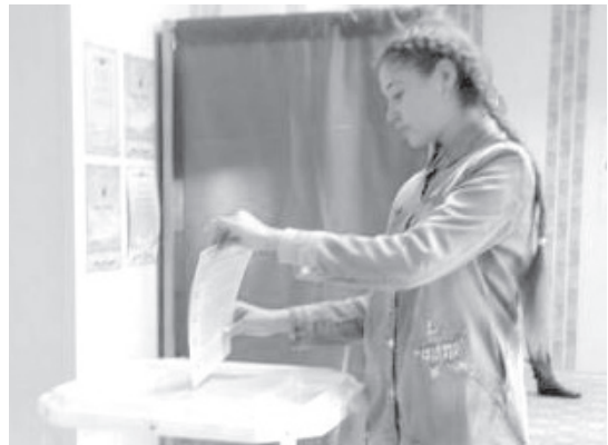
На память о первых выборах у молодых ишимцев останутся сувениры

В Ишиме всем впервые голосующим вручали сувениры с символикой родной области.