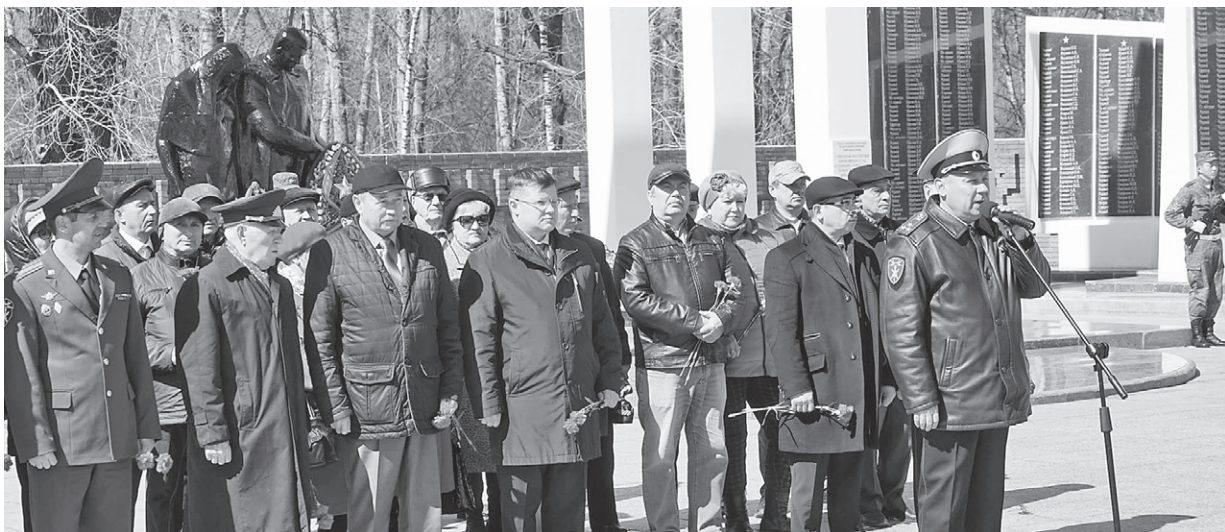
Участники автопробега «Вахта Памяти. Сыны Великой Победы» в областном центре на площади Памяти

– Для всех нас этот день необычный, потому что за емким словом «победа» стоят мужество и героизм миллионов людей, воинов и тружеников тыла, простых граждан, – обратился к участникам митинга у Вечного огня на площади Памяти начальник управления Ростгвардии по Тюменской области полковник полиции Евгений Симаков. – Гордимся тем, что в военную