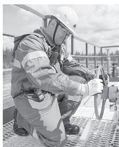
Не останавливаться на достигнутом.