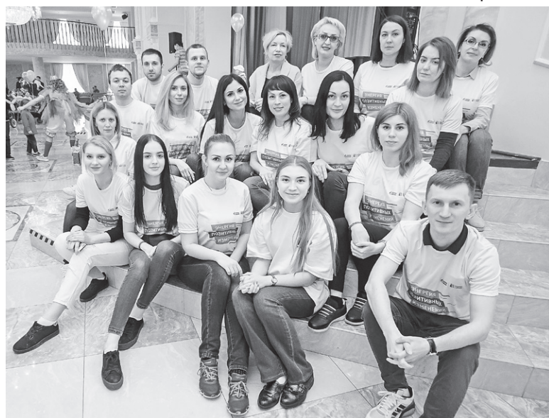
Праздник для особых детей помогли провести 30 волонтеров из «Газпромнефть-Ямала»

Многие дети были на инвалидных креслах, родители умело маневрировали в наполненных людьми переходах, никто не сталкивался, словно забота, которой были окружены малыши, имела физически ощутимое силовое поле. Бережное отношение чувствовалось во всем. Хорошо заметные волонтеры в белых футболках с логотипом «Родных городов» во всем помогали гостям, раздавали воду, двигали стулья, с доброжелательными улыбками отвечали на вопросы, обеспечивали поддержку тем, кто в этом нуждался. Еще перед входом гостей встречали сотрудники Дворца культуры, открывали двери, направляли к лифтам, но кстати, не всегда в этом преуспевали. Так, одна девочка с ДЦП вместе с мамой решительно направились к лестнице.