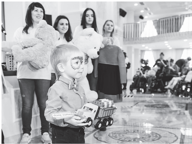
Никто из детей в этот день не остался без подарка

В двух залах, отданных под праздник, было многолюдно. Организаторы планировали принять сто детей, но пришлось