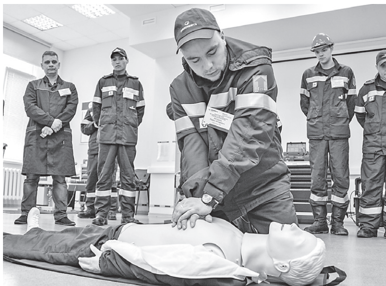
Реанимационные мероприятия на специальном тренажере. Все участники подтвердили свою компетентность в сфере охраны труда