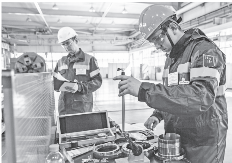
Заменить неисправную деталь, чтобы отремонтировать магистраль, – важный навык слесаря по ремонту технологических установок