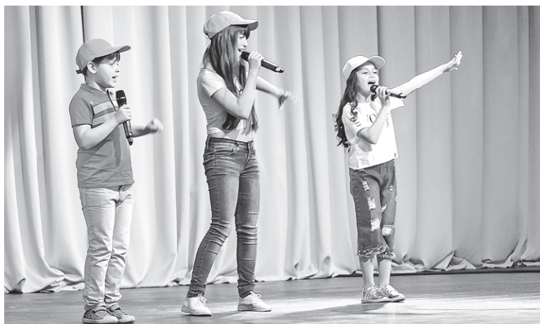
Для ребят выступили сверстники из творческих коллективов города

И действительно, девчонкам и мальчишкам в этот день предстояло для начала несколько раз пролезть в круглые отверстия в мягкой, тянущейся ткани, безоговорочно признанной ради игры сыром. Следом они перечисляли, что знают желтого, красного, синего цвета, переплетали громадные косы и наполняли разноцветными шариками игрушечных добрых змеев, успевая обниматься с новыми друзьями в процессе игры. А потом развеселившуюся ребятню ловили радугой – большим разноцветным полотнищем. Сначала ребята пытались поскорее убежать из яркой ловушки, а потом наоборот, старались попасться, когда поняли, как это интересно. К простой игре подключились дети постарше и мама с сыном, сидящим в инвалидном кресле.