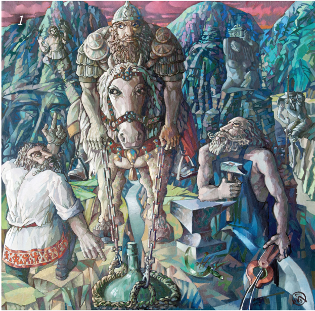
1. Святогор. 2013. Холст, масло