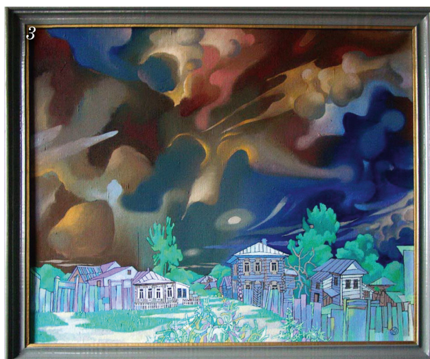
3. М.Гардубей. Небеса обетованные (улицы Герцена и Крупской)