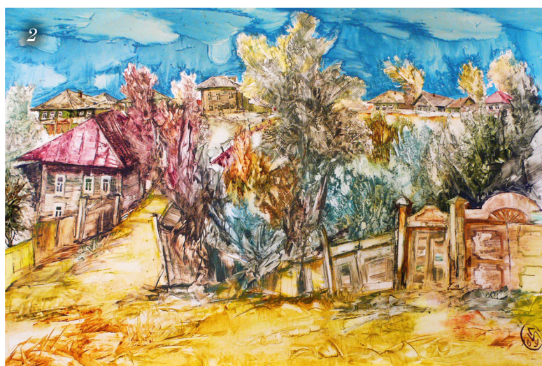
1. Фауст. 1999