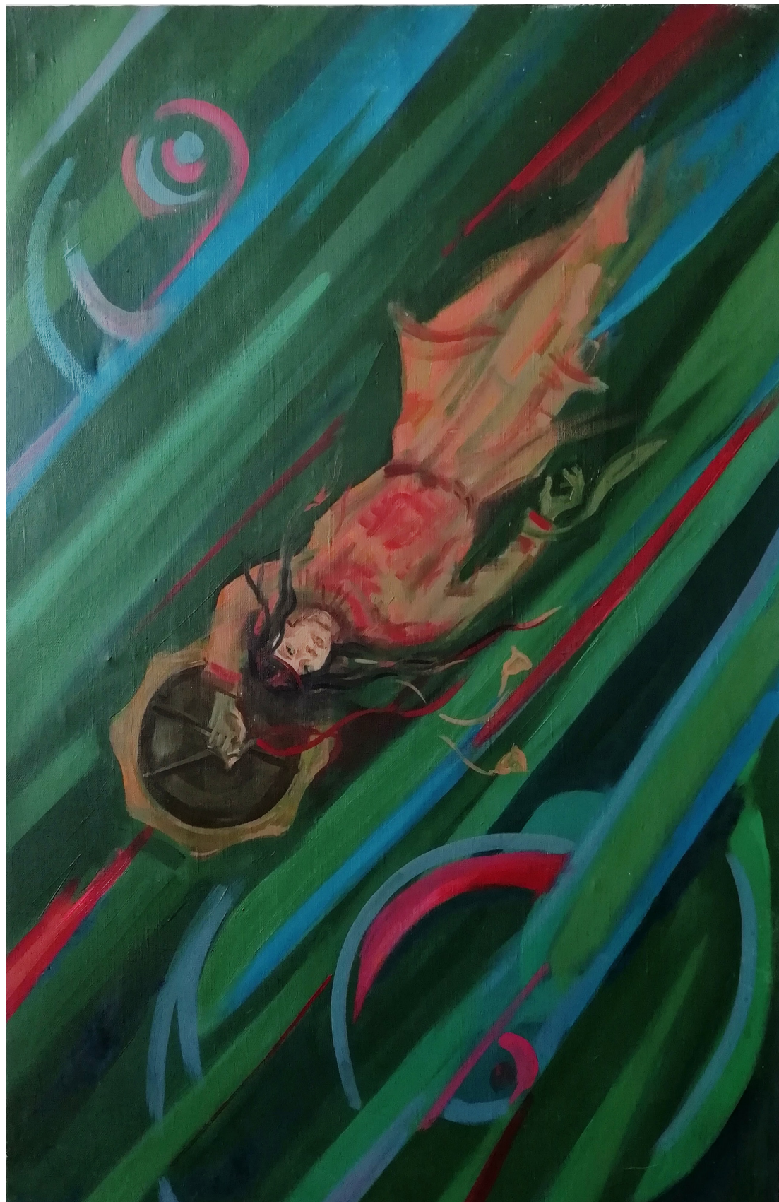
«Полет за счастъем»