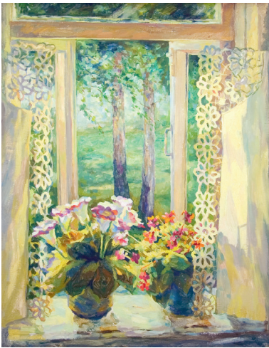
Родное окно. 1988-1989. Холст, масло