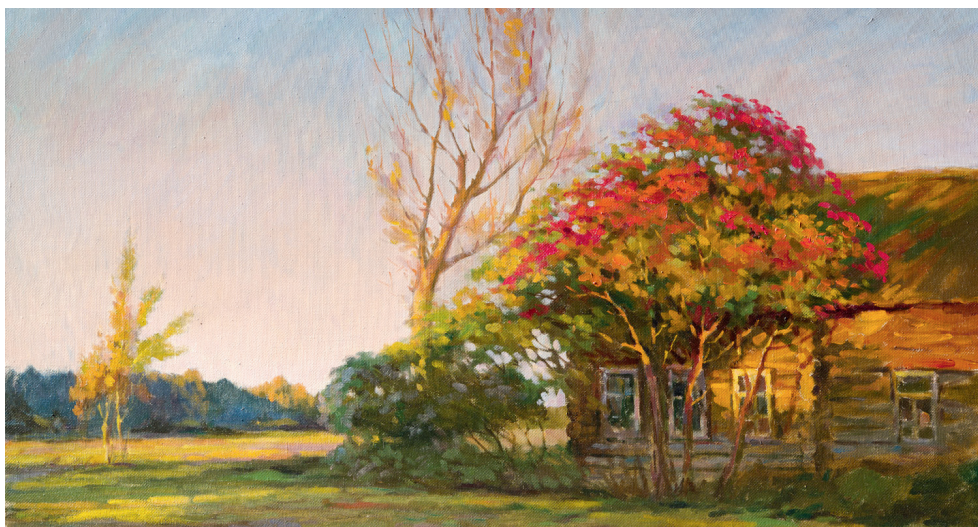
В деревнях полыхают рябины. 2009. Холст, масло