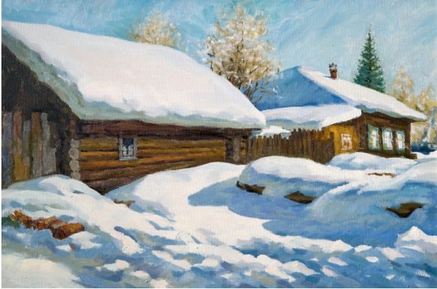
Мартовские тени. 2001. Холст, масло