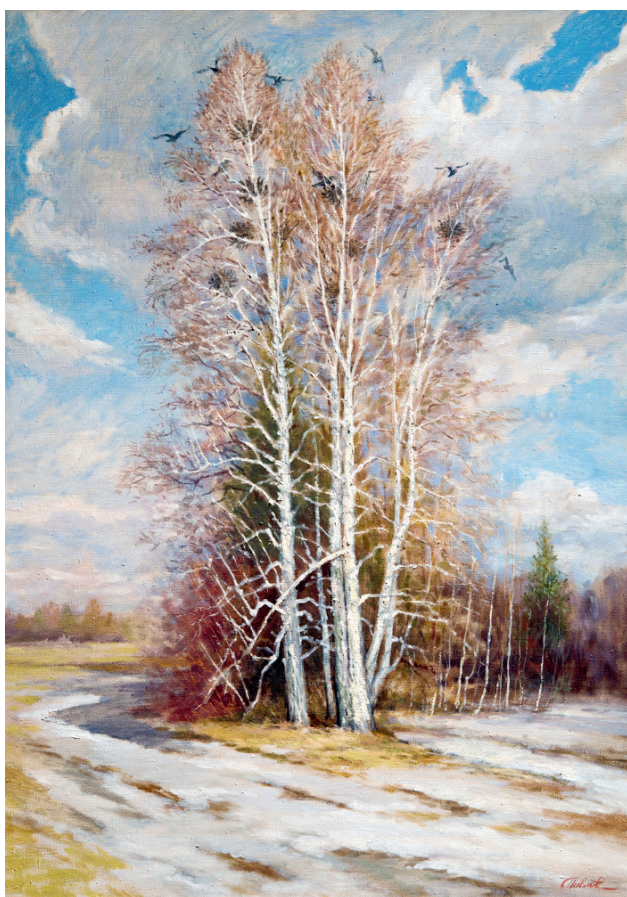
Весна пришла. Грачи. 2005. Холст, масло