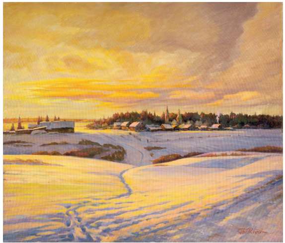
Где-то в Сибири. 2009-2010. Холст, масло