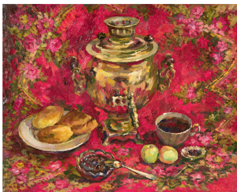
Натюрморт с самоваром. 1988. Холст, масло