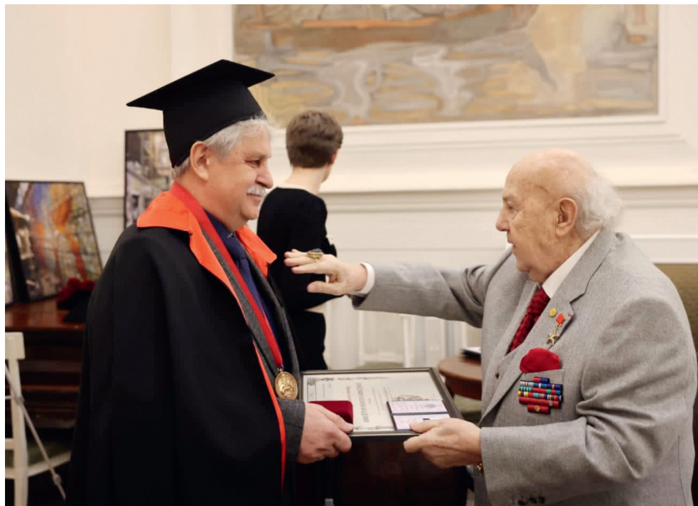
Церемония вручения академических регалий Почетного члена Российской Академии художеств Заслуженному художнику РФ Александру Павлову Президентом Российской Академии художеств Зурабом Церетели