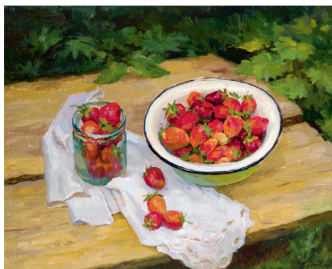
Первая клубника. 1992. Холст, масло