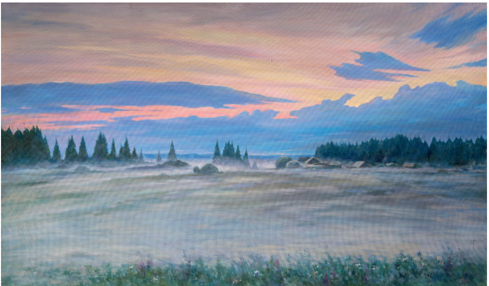
Туман. Вечный сон. 2014-2015. Холст, масло