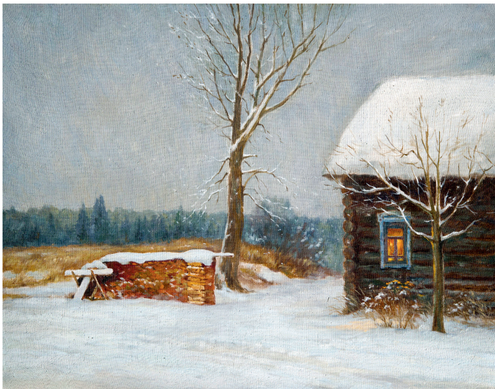
Домик у околицы. 2007. Холст, масло