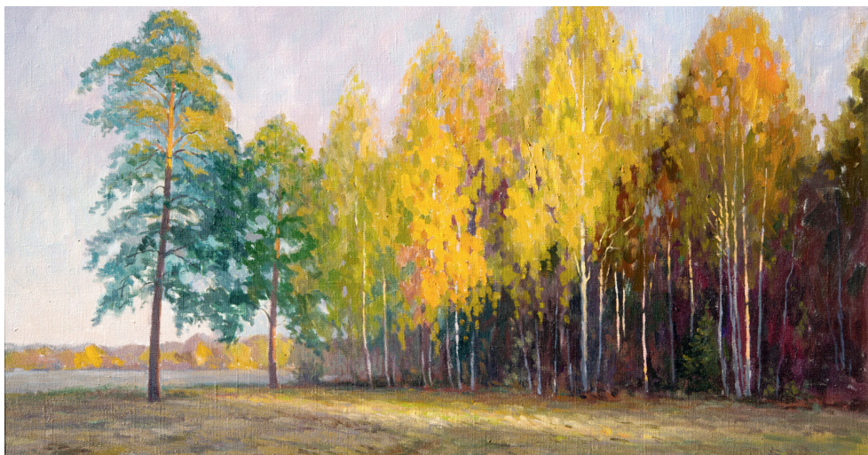
Золотая осень. Вечер. 2005. Холст, масло